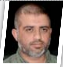
عمليات تحرير الفلوجة مستمرة ولم تتباطأ

أعلن وزير المالية هوشياري زيباري، أن العراق يتوقع بيع سندتات دولية بقيمة ملياري دولار في الربع الأخير من العام الجاري. وقال زيباري "نتوقع تلقي العراق ٦٠٠ مليون دولار في أيلول من صندوق النقد الدولي كدفعة أولى من تسهيل بقيمة ٥.٤ مليار دولار". ويشير زيباري إلى أن العراق سيحصل على كل القرض خلال ثلاث سنوات بموجب اتفاق جرى الإعلان عنه الشهر الماضي، "مبينا أن العراق يتوقع بيع سندتات دولية بقيمة ملياري دولار في الربع الأخير من عام ٢٠١٦ عندما يبدأ تدفق المساعدات الدولية". وأوضح أن "ذلك سيساعد على تخفيض تكلفة الاقتراض على بغداد". ويسعى العراق للحصول على دعم دولي بعد تقلص إيراداته جراء انهيار أسعار النفط قبل نحو عامين، وتعتمد الحكومة على النفط في ٩٥ بالمئة من دخلها.