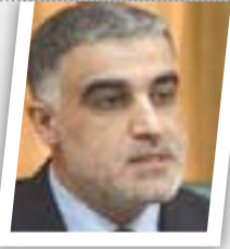
ندعو لتشكيل هيئة مؤقتة لمعالجة أوضاع المناطق المحررة

وقال الكلابي إن "عملية تحرير الفلوجة ماضية ولم تتوقف ولم تتباطأ"، مبينا ان "المقاتلين الإبطل من الحشد الشعبي والقوات الأمنية يواصلون قتالهم لتحريرها". وأضاف المسؤول في الحشد أن "رئيس الوزراء القائد العام للقوات المسلحة أكد خلال اجتماعه في مقر عمليات الفلوجة مع قيادات الحشد والأجهزة الأمنية انه لا يتعرض ولا يستجيب لأي ضغط غير المصلحة الوطنية العراقية، والتي ستكون انقاذ المعرّضات وتحرير كامل أرضنا العزيزة". وكانت عصائب أهل الحق قالت، الجمعة، إن بعض الدول الداعمة لـ "داعش" تمارس ضغوطا كبيرة على رئيس الوزراء حيدر العبادي من أجل إيقاف معركة تحرير الفلوجة.