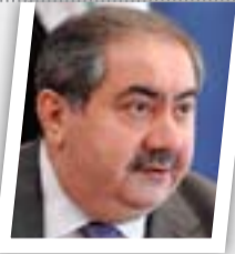
سنطرح سندتات دولية بقيمة ملياري دولار