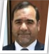
انتصارات الفلوجة أفضلت المترصبين بوحدة العراق