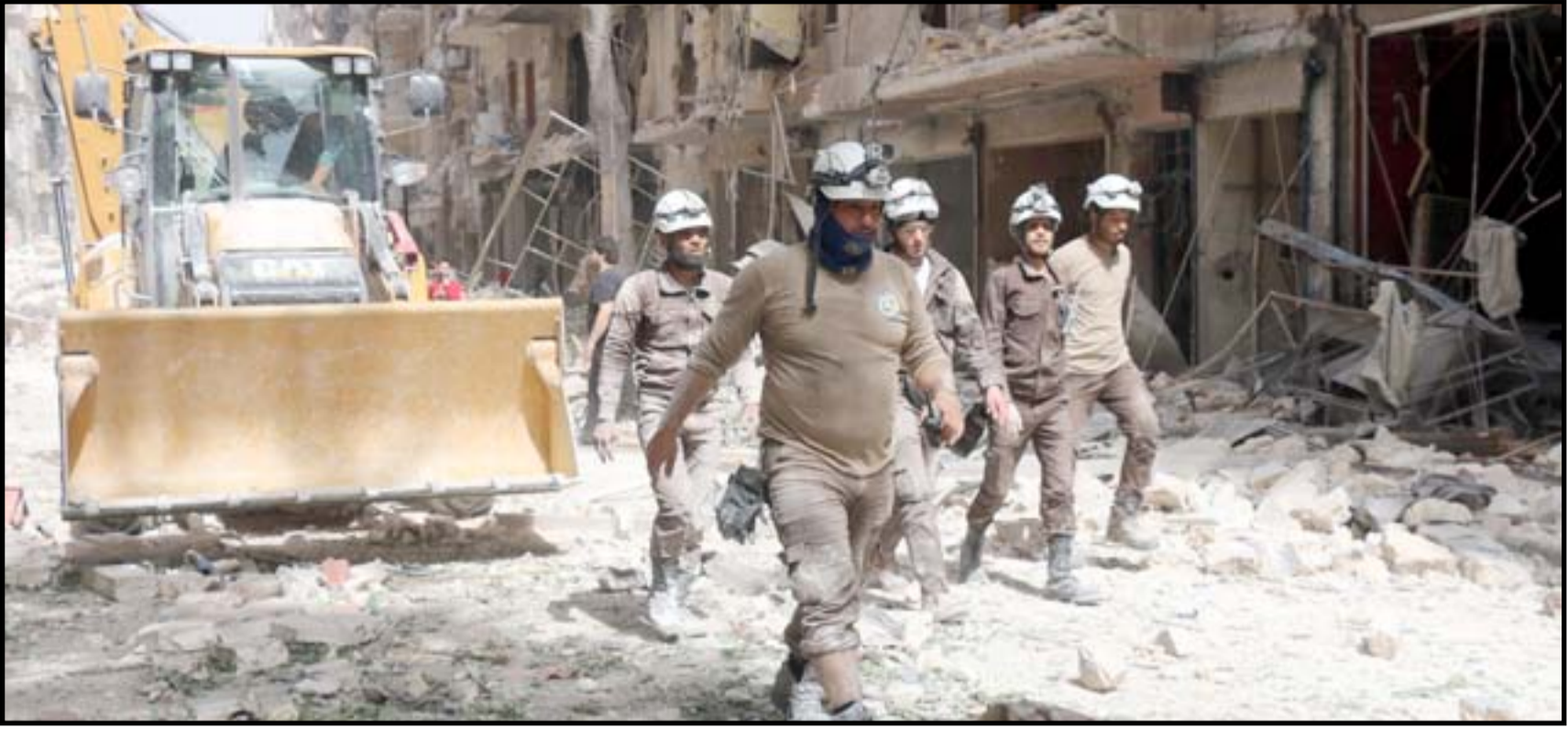
الدفاع المدني وسط الحطام بعد الغارة الجوية التي أبلغ عنها القوات الحكومية السورية في حي يسيطر عليه المتطرفون من السوري في مدينة حلب..